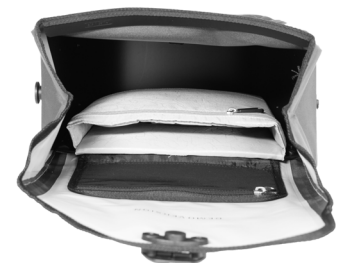
Gepolstertes Innenfach für Laptop