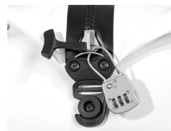
Drahtbügel zum Abschließen mit Vorhängeschloss (Schloss nicht enthalten)

Bergsteiger TIPP Dichte, Bergsteiger, Februar 2011