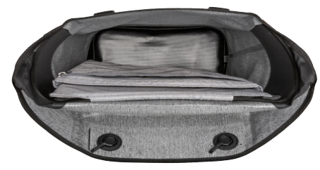
Innenansicht mit Laptopfach