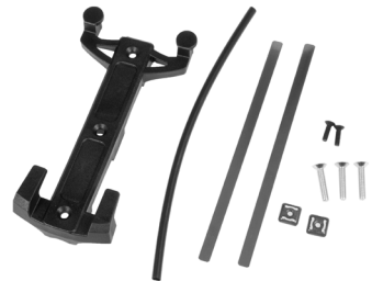
Quick-Lock S Adapterplatte inkl. Befestigungszubehör (im Lieferumfang enthalten)