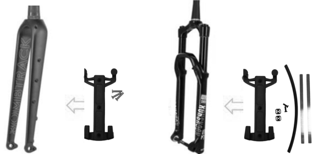
Quick-Lock S Adaptersystem bei Gabeln mit Schraubbefestigung