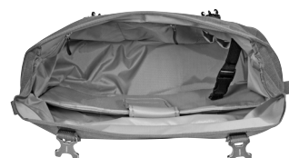
Innenansicht: gepolstertes Innenfach für Notebook