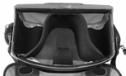
Innentaschenunterteilung Ultimate Internal Divider (separat erhältlich)