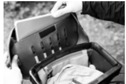
Öffnung Deckelfach: 21,5 cm