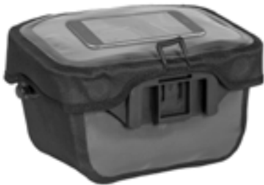
Smartphone im transparenten Deckelfach (nicht enthalten)