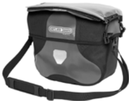
Befestigungsmöglichkeit für die Kartentasche Ultimate Map-Case (separat erhältlich)