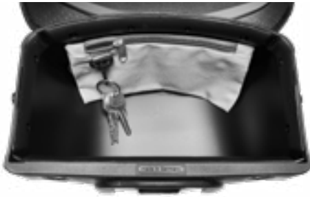
Karabiner mit Schlüsselbund